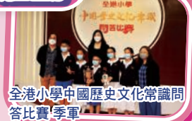
全港小學中國歷史文化常識問答比賽季軍