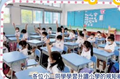
各位小一同學學習升讀小學的規矩禮儀，為成為優異的小朋友做好準備。