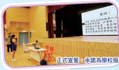
正式宣誓，承諾為學校服務做到最好。