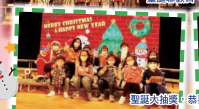
聖誕大抽獎,恭喜獲獎的同學。