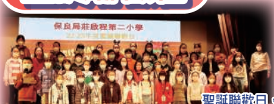
聖誕聯歡日,學校合唱團表演。