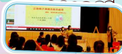
10月7日舉辦了「正面親子溝通及衝突處理」家長講座，以協助提升家長認識更多正向管教技巧。