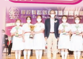
全港第一屆香港青少年升旗儀式比賽小學組季軍

第五十八屆學校舞蹈節小學中國舞小學組團體獎冠軍 高年級組中國舞(群舞)優等獎 低年級中國舞(群舞)優等獎 高年級組中國舞(獨舞)優等獎