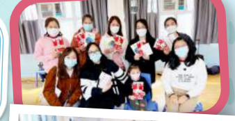
12月亦舉辦了一連四節的「管教我有『say』」家長小組，以供家長思考及選擇適合的管教模式。