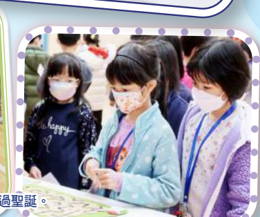
同學投入攤位及課室活動，開開心心過聖誕。