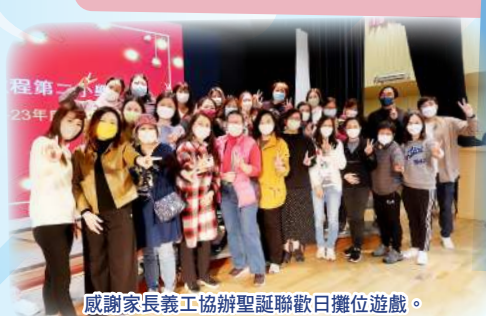
感謝家長義工協辦聖誕聯歡日攤位遊戲。