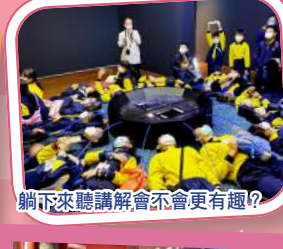
躺下來聽講解會不會更有趣？