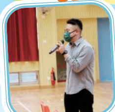
各位風紀正式就職，每一位都是各位同學的榜樣，期待為各位同學和老師服務。