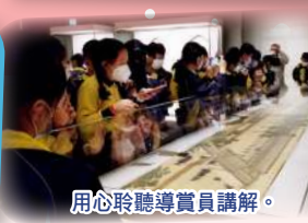
用心聆聽導賞員講解。