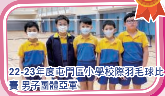
22-23年度屯門區小學校際羽毛球比賽男子團體亞軍