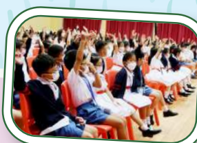
10月14日舉辦了「情緒多面睇」學生講座。

學校逢星期五的德育課均有不同的主題，當中包括講座及活動以培育學生正面的價值觀和態度。