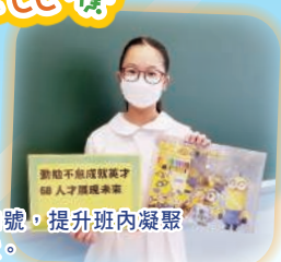
各班的同學選出最具代表性的班口號，提升班內凝聚力。創作的同學獲得獎品，鼓勵創意。